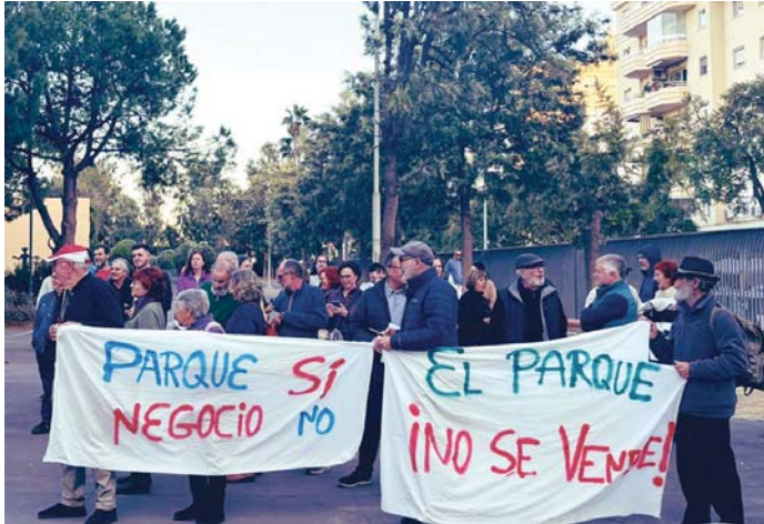
Imagen de archivo de una de las protestas contra la instalación del festival.

Los socialistas han reconocido “la victoria ciudadana frente al hurto ejecutado por el PP sobre el Parque del Oeste”, en el distrito de Carretera de Cádiz.