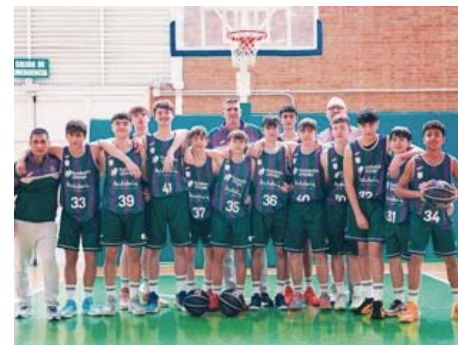
Plantilla del Unicaja Andalucía. UNICAJA B. FOTOPRESS

El debut del Unicaja Andalucía será el miércoles 12 de febrero a las 16:00 horas frente al FC Barcelona. La competición mantendrá el formato de dos grupos de cuatro equipos cada uno, con los dos mejores de cada grupo avanzando a semifinales el sábado 15 de febrero. La gran final se jugará el domingo 16 en el Gran Canaria Arena.