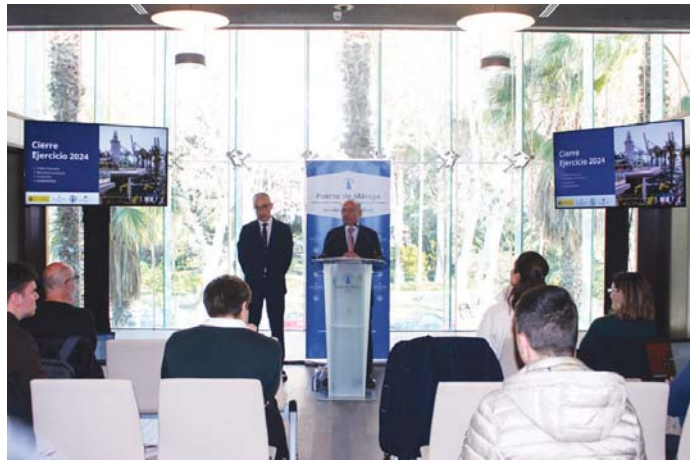
El presidente de la Autoridad Portuaria de Málaga, Carlos Rubio, en rueda de prensa. VM

El punto negativo, que no ha afectado a acabar el año con beneficio positivo, lo ponen los graneles sólidos y líquidos con un descenso del 6,8 por ciento (1,2 millones de toneladas) y del 18,5 por ciento (112.859 toneladas), respectivamente.