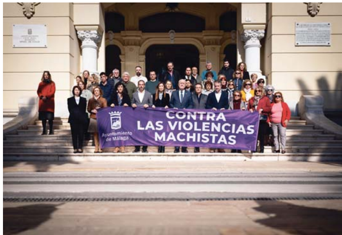
Siguen los actos de repulsa como el minuto de silencio mantenido en el Ayuntamiento de la capital. UNICAJA

Mientras tanto, el Juzgado de Violencia sobre la Mujer número 3 de Málaga, que fue el mismo que denegó en su día las mediadas cautelares demandadas por la víctima mortal, ha acordado este martes el ingreso en prisión provisional, comunicada y sin fianza del hombre que, presuntamente, ha matado a su mujer en presencia de sus hijos menores.