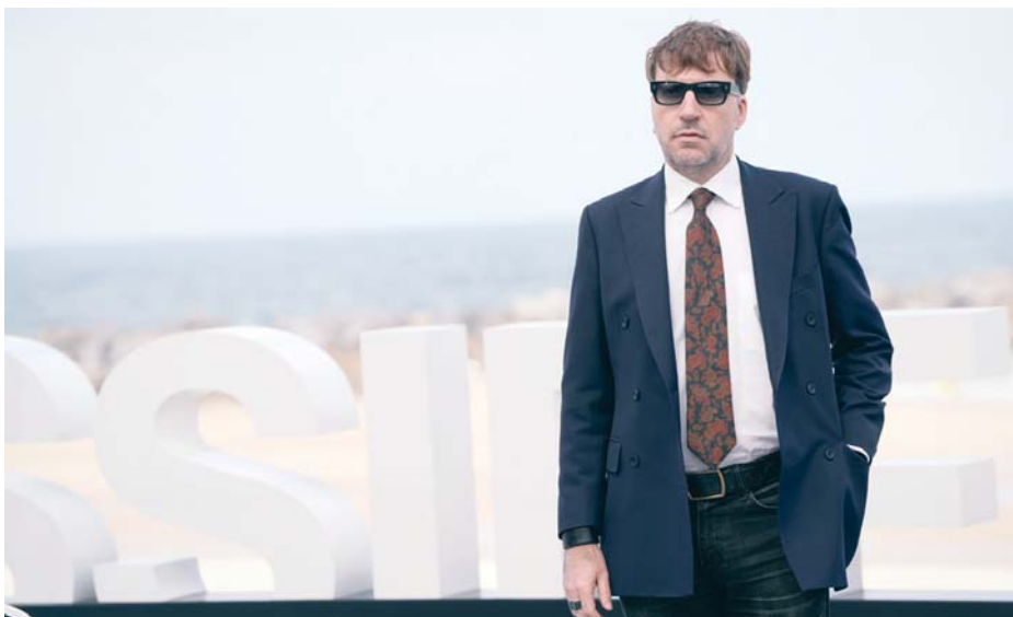
El director Albert Serra posa durante la presentación del documental 'Tardes de soledad' en el Festival de San Sebastián.

Asimismo, en este documental, según el acta, el director aborda la figura del torero "como un auténtico héroe contemporáneo y un artista en constante compromiso con su arte, abordando temas universales como el mie-