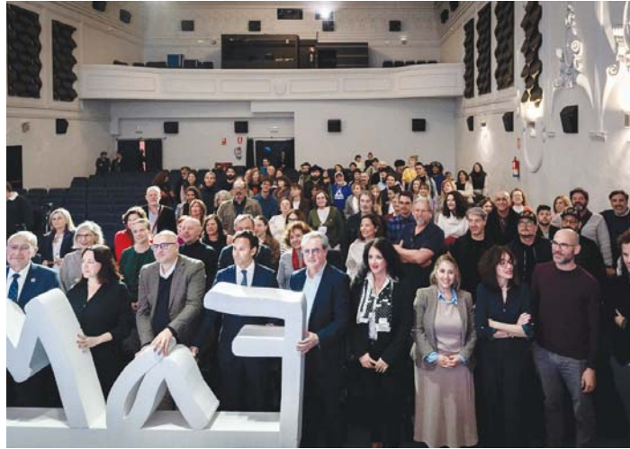
Así ha sido la presentación de las actividades de Málaga de Festival en el Cine Albéniz. VM

Esta edición cuenta con un programa ambicioso que combina voces consolidadas con creadores llamados a marcar el músculo de su tiempo